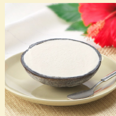
・ ココナッツアイス 480円