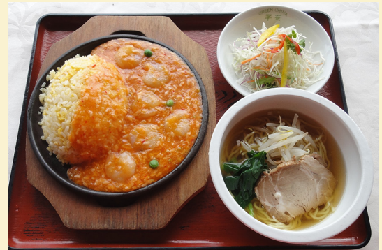
写真はエビチリチャーハンセット