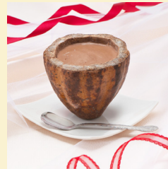
・ カカオショコラアイス 480円