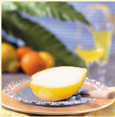
・ レモンアイス 480円