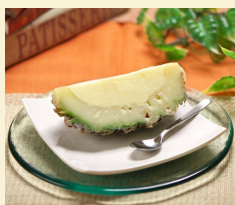
・ パインアイス 480円