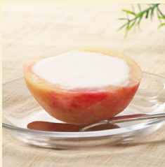
・ ピーチアイス 480円