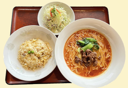
写真は担々麺セット(赤)