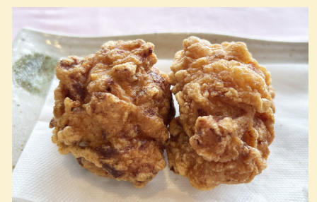
鶏のから揚げ 〈2個〉 420円