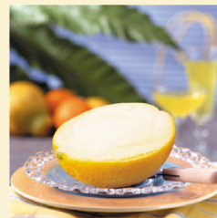
・ オレンジアイス 480円