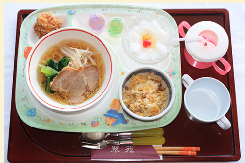
写真はお子様セット