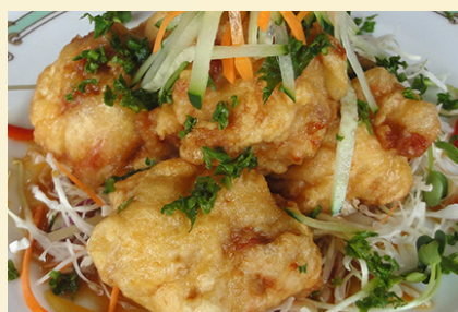
から揚げの甘酢ソースかけ 780円