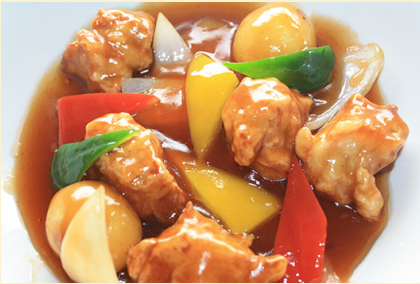
甘酢あんかけ・黒酢あんかけ 酢豚 1,150円