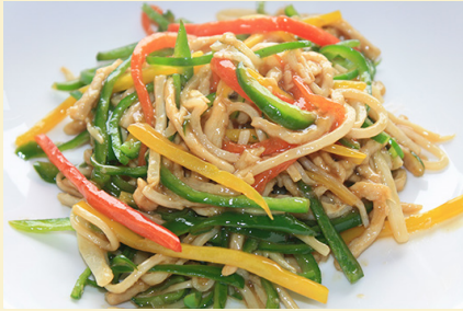
豚肉とピーマンの炒め 1,250円