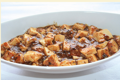
🌶️ 麻婆豆腐 950円 🌶️ 四川麻婆豆腐 950円