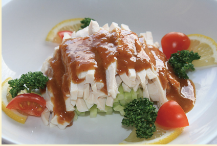
蒸し鶏のゴマソースかけ 1,050円