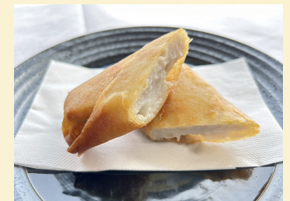
里芋の春巻き 〈1本〉280円