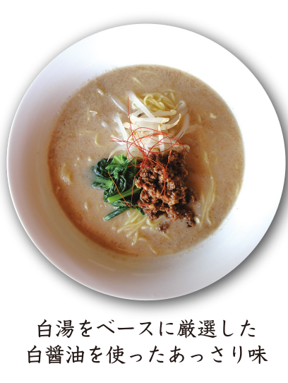
白湯をベースに厳選した 白醤油を使ったあっさり味