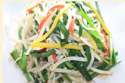
ニラとモヤシ炒め 800円