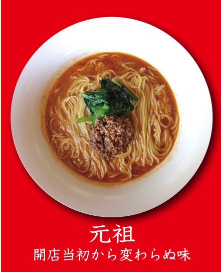
元祖 開店当初から変わらぬ味