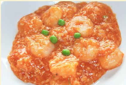
🌶️ エビのチリソース 1,200円