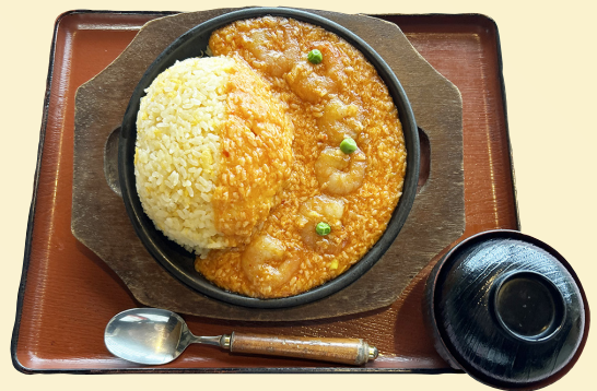
写真はエビチリチャーハン