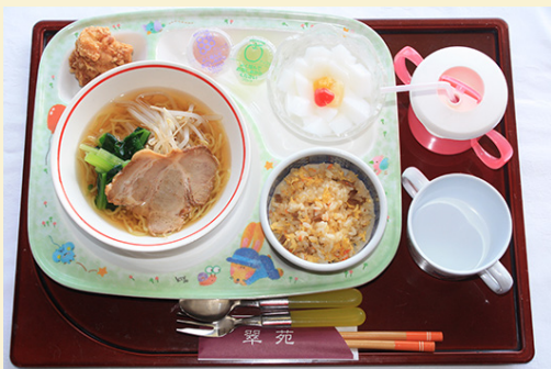
写真はお子様セット