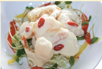
エビのマヨネーズ和え 980円