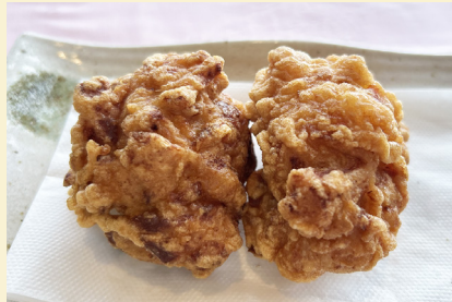
鶏のから揚げ 〈2個〉420円