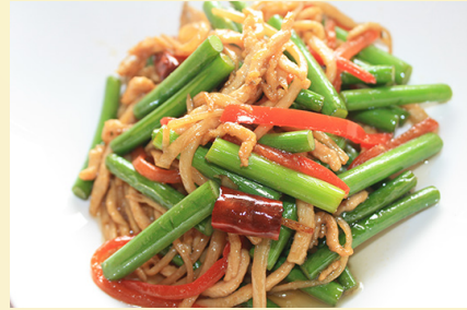
豚肉とニンニク茎の炒め 1,250円