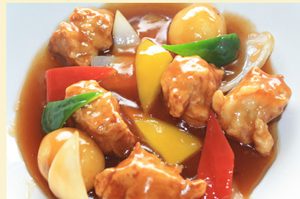
甘酢あんかけ・黒酢あんかけ 酢豚 1,150円