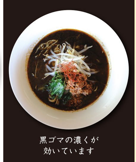
黒ゴマの濃くが 効いています