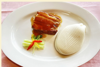
皮付きバラ肉の醤油煮込み 〈パン付〉 1,300円