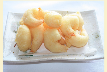
エビの天ぷら 〈8個〉820円